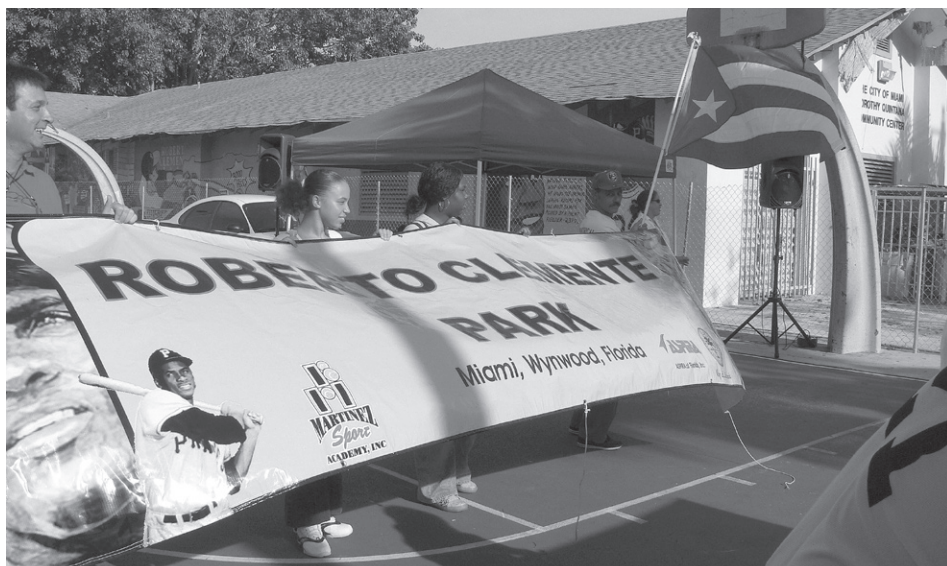
Bandera que usa la Academia de Sports (liga infantil), que ya no puede jugar en el parque.