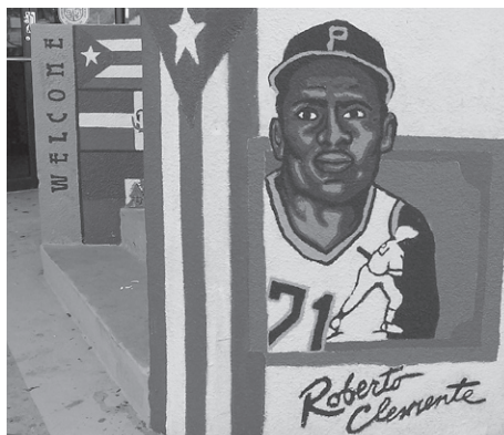
Entrada al edificio, pintada con alegorías a Roberto por Aspirantes.