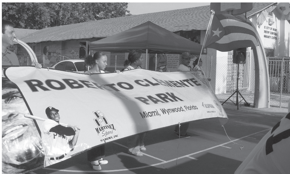
Bandera que usa la Academia de Sports (liga infantil), que ya no puede jugar en el parque.