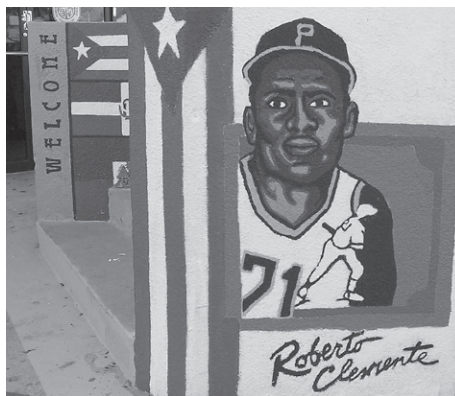
Entrada al edificio, pintada con alegorías a Roberto por Aspirantes.